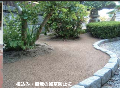
植込み・植栽の雑草防止に