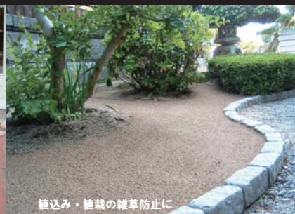
植込み・植栽の雑草防止に